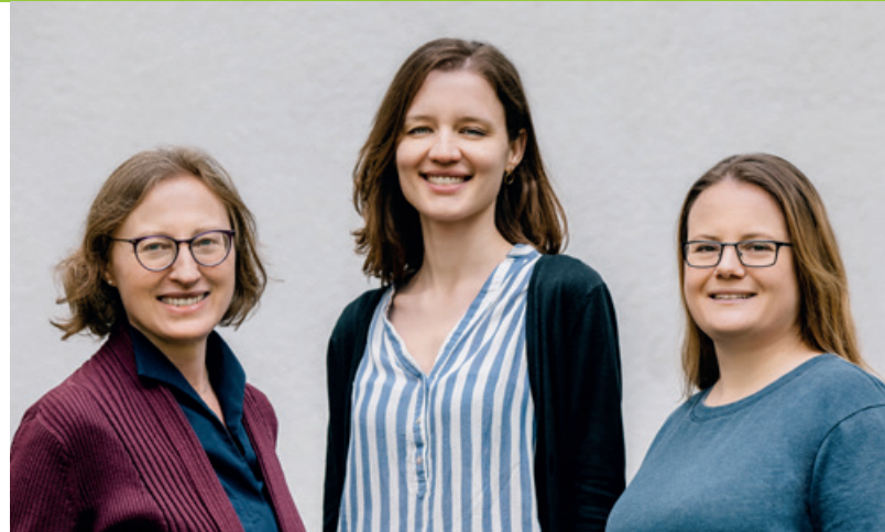
Das Team der Kontaktstelle PflegeEngagement Reinickendorf: (v.l.n.r.)

U8 + S1 bis Wittenau, Bus X21, X33, M21, 120, 122, 124, 221 bis Wilhelmsruher Damm / Treuenbrietzener Straße