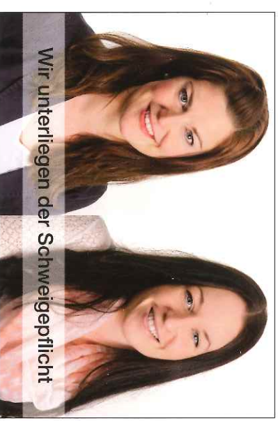
Wir unterliegen der Schweigepflicht

Alle Eltern wollen das Beste für ihre Kinder. Jedoch können Eltern, die einen problematischen Umgang mit Suchtmitteln haben, ihre persönlichen Stärken oft nicht voll einsetzen und den Kindern zur Verfügung stellen. Das aktuelle und spätere Leben der Kinder wird dadurch entscheidend mitgeprägt. Das Gruppenangebot soll die Eltern in ihren Bemühungen unterstützen und den Kindern einen ergänzenden Schutz & Geborgenheitsraum bieten.