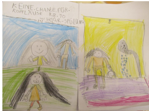
Kunstwerk 1. Jahrgangsstufe „Kopfläuse“