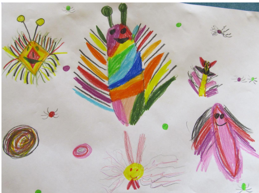
Kunstwerk 2. Jahrgangsstufe „Welt der Mikroorganismen“

Weitere Infos und Bilder www.fieberica.de