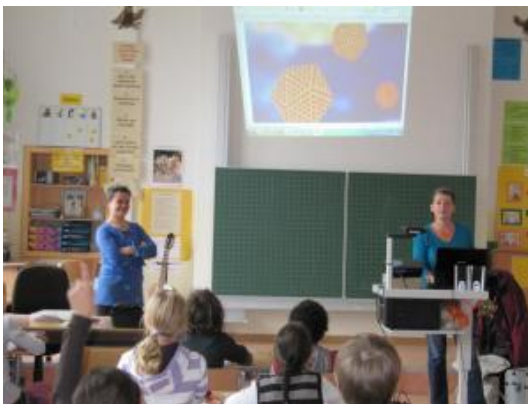
Ausflug in die Welt der Mikroorganismen